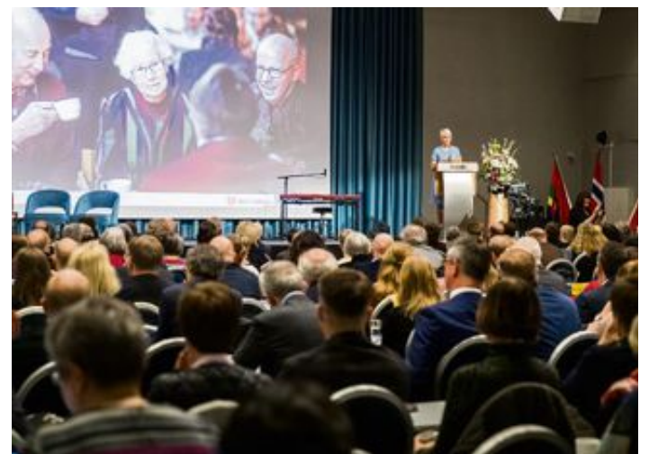
«Troen finnes kanskje på en ny måte, som ikke kommer frem i de kirkelige statistikker» skriver innleggsforfatteren. Bildet er fra årets kirkemøte som nylig ble avholdt i Trondheim.